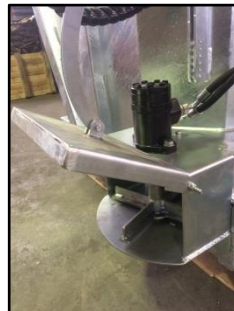
Rotore esterno per compost e simili