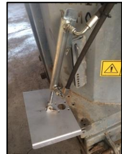
Botola laterale a comando idraulico