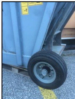
Ruote pneumatiche posteriori di supporto