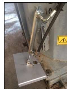
Botola laterale a comando idraulico