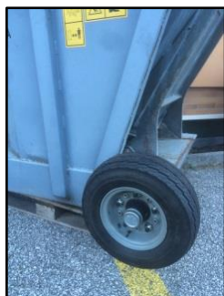
Ruote pneumatiche posteriori di supporto